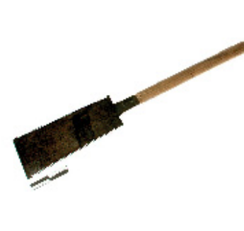
De ryoba .

Tijdens deze Doe leer je de Japanse zaag of nokogiri gebruiken. Deze is erg verschillend van de zagen die hier in het westen gebruikt worden omdat zij op de trekrichting snijdt. Er bestaan veel uiteenlopende vormen die elk een specifieke functie hebben. Tijdens de Japanse zaag-Doe beperken we ons tot het gebruik van de ryoba en de maebiki . De ryoba is de meest universele vorm van de Japanse zaag en heeft aan beide zijde een verschillende vertanding. Zij kan zowel worden gebruikt voor het afkorten als voor schulpen. De maebiki is een grote schulpsaag die wordt gebruikt voor het verzagen van stammen in planken of balken. Deze zaag wordt vandaag niet vaak meer gebruikt door de beschikbaarheid van lintzagen.