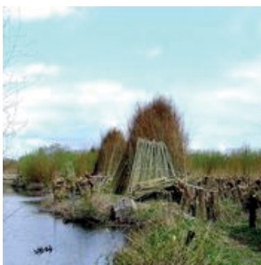
Een griend in de Biesbosch (Nederland).

Rechte twijgen van wilgen werden tot voor kort voor duizend en één dingen gebruikt. Van het bijeenbinden van groenten over het vlechten van manden tot het maken van oeverversterkingen. Om mooie rechte takken te krijgen, hakt men de boom op een bepaalde hoogte volledig af. Het bekendste resultaat van deze techniek is de knotwilg, maar er kan ook lager geknot of met de grond gelijk afgezet worden. Op plaatsen waar men zich specialiseerde in de productie van wilgenhout, plantte men hele velden aan met wilgen. Zo'n plantage noemen we een griend. Om een griend aan te leggen, te onderhouden en de wilgentakken te oogsten, gebruikte de griendwerker een hele reeks werktuigen. Deze werktuigen kan je sinds kort ontdekken op ID-DOC .