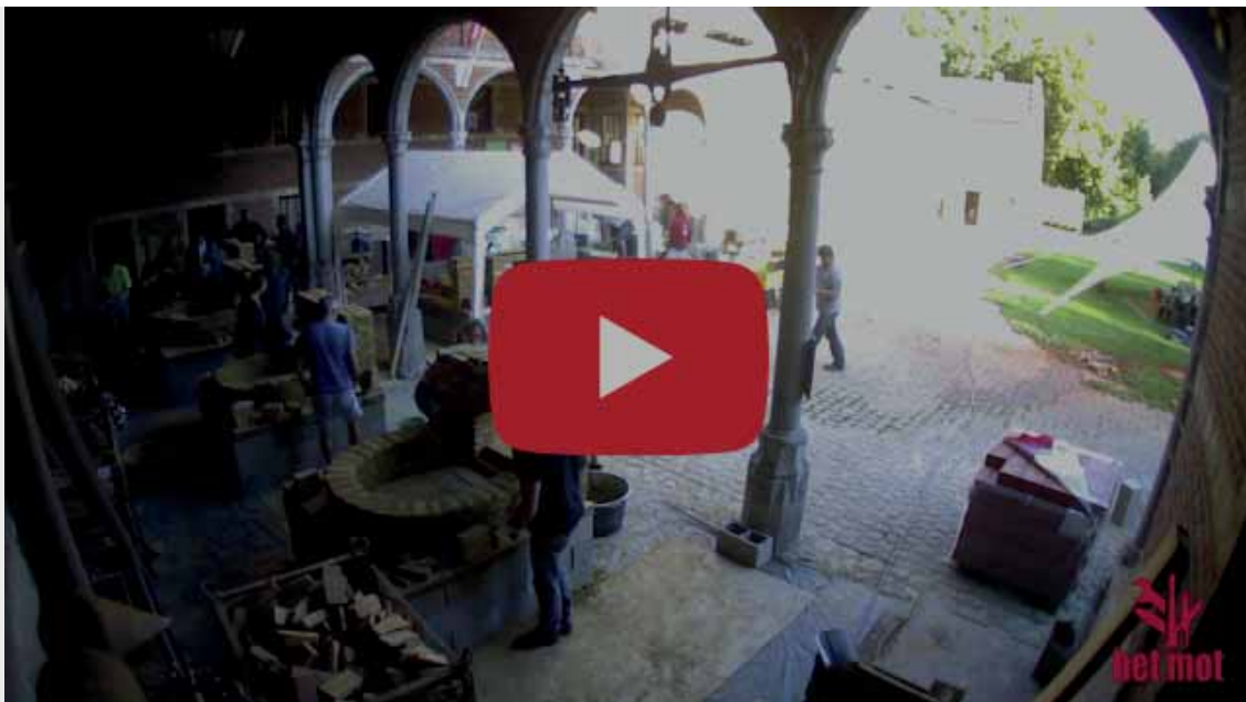
Driedaagse Stage bouw zelf je oven in een timelapse van 1 minuut

Niets beter dan je zelf gebakken brood, pizza of taart uit de bakoven. Of toch...? Je zelf gebakken brood, pizza of taart uit je zelfgebouwde bakoven!