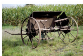
De hooischudder in de collectie van het MOT

In deze nieuwsbrief stellen we de hooischudder aan u voor. Volgende maand komt de spuitmachine aan bod.