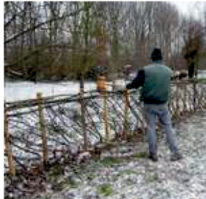
Het leggen van de haag tijdens de koude winter.

In de zomer van 2011 zorgde het MOT voor een informatiebord over de gelegde haag. Deze meidoornhaag kunt u nog steeds bewonderen in het door Natuurpunt beheerd natuurgebied achter de Charleroyhoeve in Grimbergen.