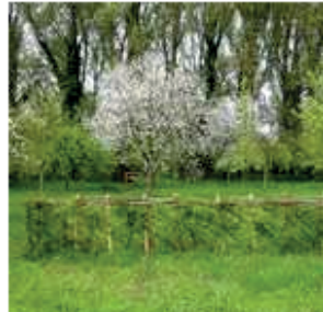
De gelegde haag tijdens de zomer.