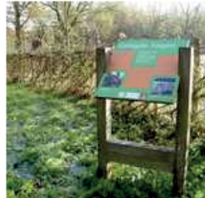
Het informatiebord over de gelegde haag.