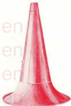
Pavillon Cuivre Amplificateur T. A. 2. Orifice environ 52 c/m.