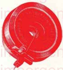
Notre Diaphragme "Exhibition", Fr. 37.50

Toute personne possédant déjà un Gramophone 5, 9 et 13, non pourvu du BRAS CONIQUE B, peut nous en demander le placement pour le prix de 75 francs (Pavillon T. A. 1, ou « Volubilis » couleur et diaphragme Exhibition compris). Port à la charge du client. — Les anciens accessoires, étant sans valeur pour nous, ne peuvent être repris.