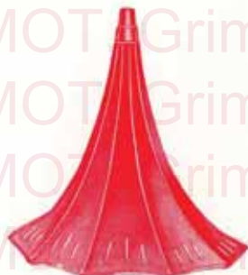
Pavillon «Volubilis» noir, rouge ou vert Orifice environ 57 c/m.