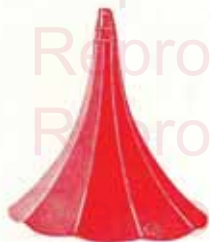
Pavillon Volubilis «Victor» noir ou vert Orifice environ 43 c/m.