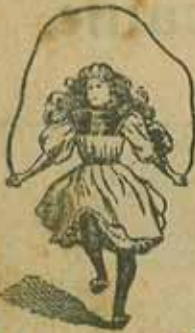
CORDE A SAUTER METALLIQUE

The King Spring Co BUFFALO, N. Y., U. S. A.