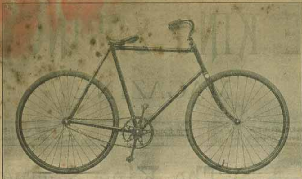
Bicyclette Américaine « King Spring » Véritable bracket Fauber. Prix : Fr. 225.00