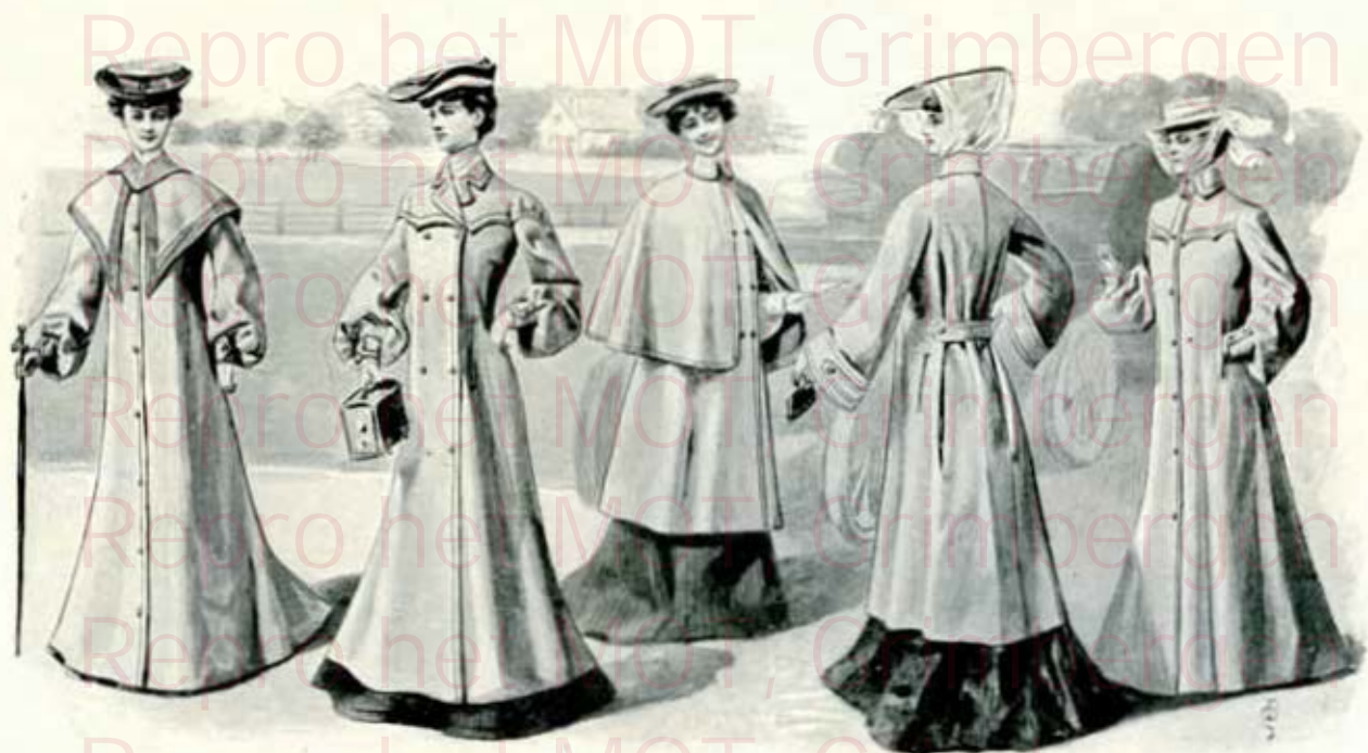
Redingote à collet