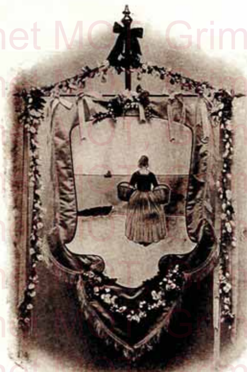
10 - Bannière pour corso fleuri.