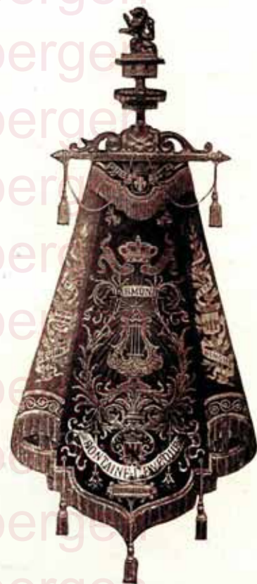
1 — Bannière en velours avec revers de soie