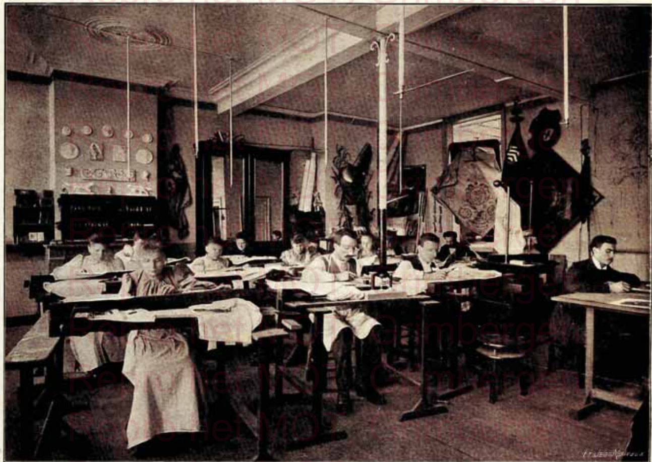
ATELIER DE BRODERIE POUR LA CONFECTION DES DRAPEAUX ET BANNIERES DE SOCIÉTÉS