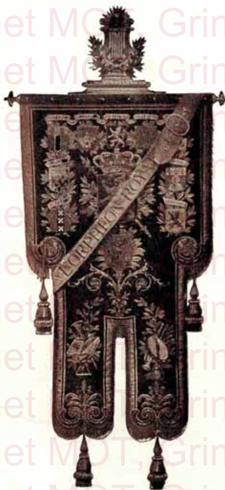
4 — Bannière en velours brodée d'or et d'argent