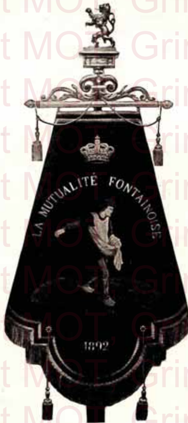
3 — Bannière en velours, brodée de soie et d'or.