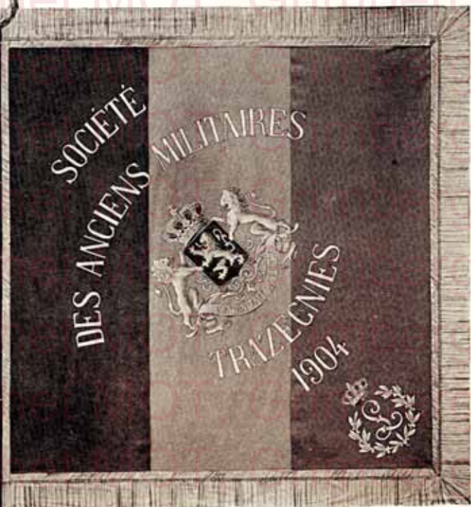
7 — Drapeau en soie brodé d'or et d'argent