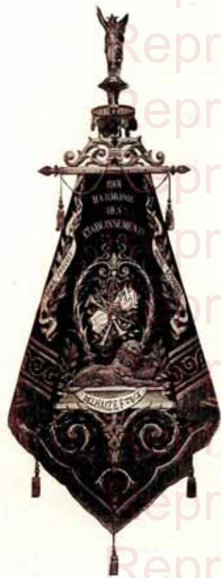
2 — Bannière en velours avec revers de velours