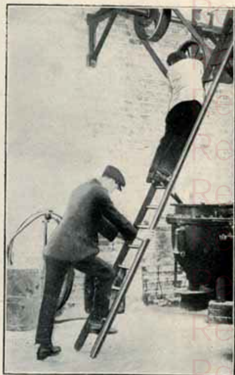
Sans emploi du SABOTSUR

ADOPTÉ par les principales usines de mécanique, ateliers de construction, entrepreneurs, décorateurs, tapissiers, peintres, etc.