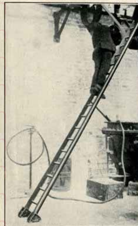
Avec emploi du SABOTSUR

Peut également se placer à la partie supérieure des échelles pour protéger la surface des murs.