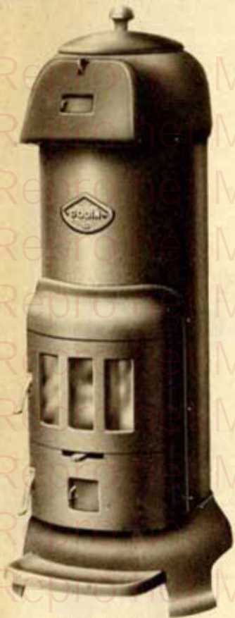
N° 261 à 263

Ces calorifères possèdent un fût en tôle, garni intérieurement de briques réfractaires. La partie supérieure de la tête est protégée par une doublure intérieure en fonte. Un tampon est disposé sous le couvercle. Le décendrage se fait par grille à tirette. Combustible : anthracite 20/30 - coke - boulets.