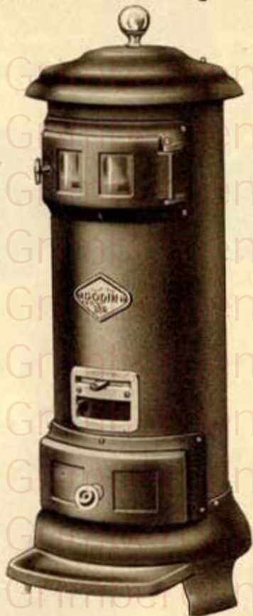
N° 285 à 286

Ces calorifères possèdent un fût en tôle, garni intérieurement de briques réfractaires. Une série de cercles et tampon est disposée sous le couvercle. Le décendrage se fait par grille à tirette. Ces appareils peuvent être munis d'une taque chauffante. Combustible : anthracite 20/30 - coke - boulets.