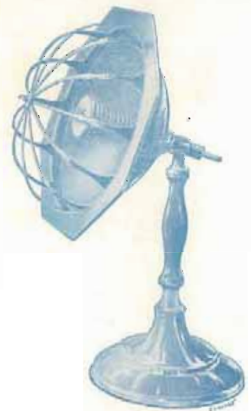
300 à 500 Watts