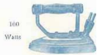
N° 4 - Poids 1 k. 800