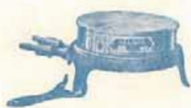
N° 12 - 300 Watts