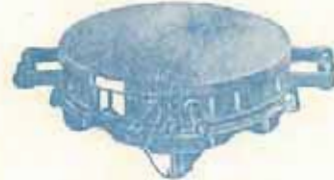
N° 22 - De 150 à 700 Watts