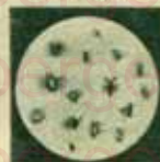
De mikroben van de besmettelijke ziekten