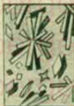
Kristallen van urine zuur