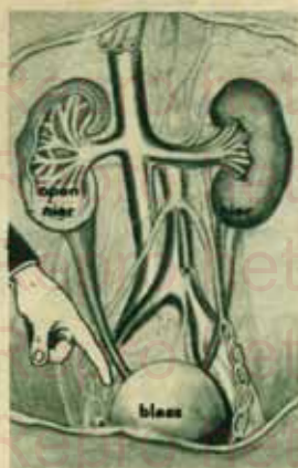
Hoe de nieren aan de blaas vast zijn.

Wanneer gij ziek zijt en een geneesheer raadpleegt, dan beveelt hij bijna altijd een ontleding der urine. Volgens de kleur, de reuk, de vastheid, de omvang der urine zal de geneesheer een ziekte kunnen opsporen, er de oorzaken van vaststellen, de gepaste behandeling toepassen en de afdoendheid er van nagaan. Het is de ontleding der urine die zal aanwijzen of de zieke is aangetast door eiwit- of suikerziekte, of hij lijdt aan den lever, de blaas, de nieren, enz.