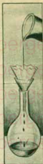
De nieren spelen den rol van filter in de menschelijke bewerk-tuiging.

In meer ontwikkelden vorm kan het bezinksel van deze zouten aanleiding geven tot graveel of steentjes, een der pijnlijkste aandoeningen die dikwijls op een operatie uitloopt.