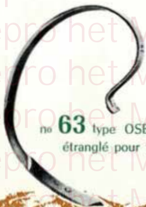
no 63 type OSBORN étranglé pour tubes