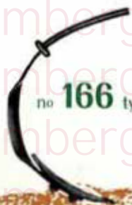
no 166 type T. P. A. I.