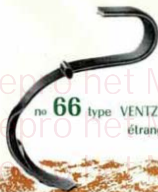
no 66 type VENTZKY étranglé