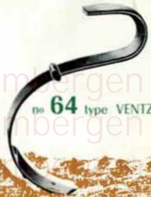
no 64 type VENTZKY