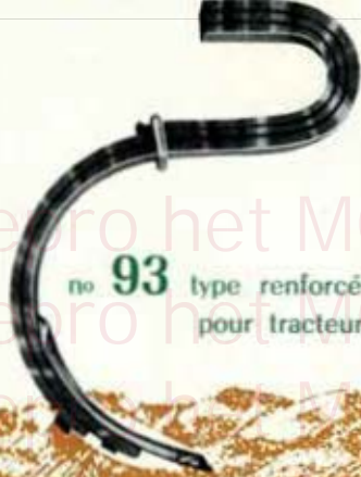
no 93 type renforcé pour tracteur