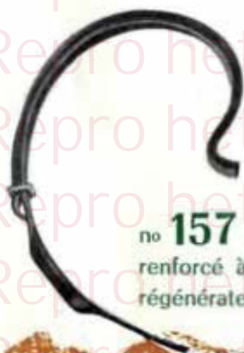
no 157 type OSBORN renforcé à 2 lames pour régénérateurs de prairies