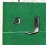
No 158 31