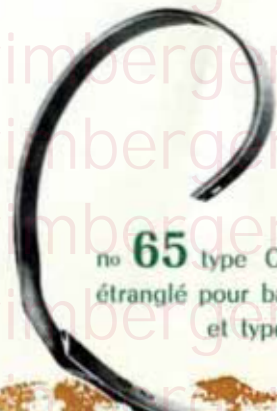
no 65 type OSBORN étranglé pour barre plate et type ALBERT