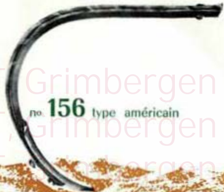
no 156 type américain