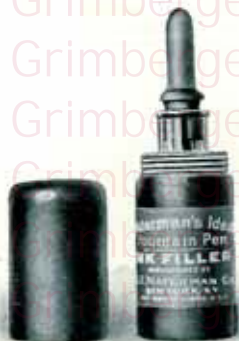
FLACON DE VOYAGE 1.50

Nous recommandons tout spécialement pour le voyage le flacon "IDÉAL" incassable.