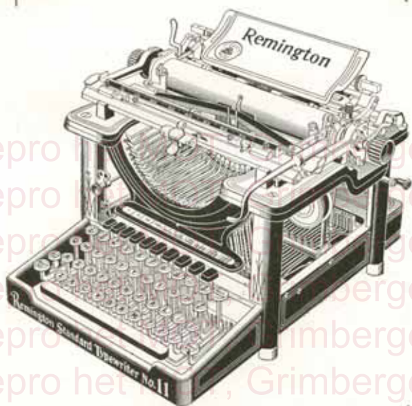
MODÈLE N° II

Les nouveaux modèles 10 et II sont construits sur les principes Remington aussi bien dans leurs parties les plus importantes que dans les plus petits détails.