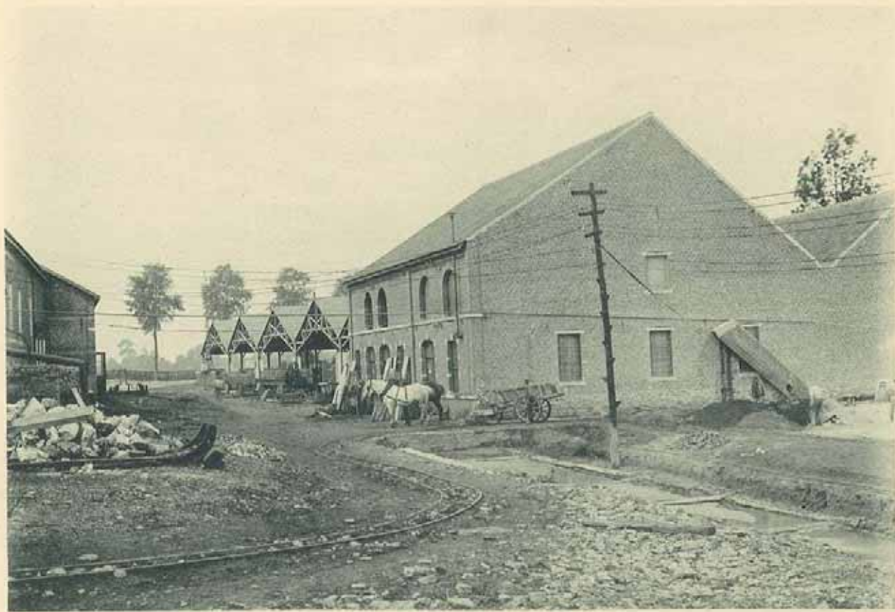
Ateliers et Magasins