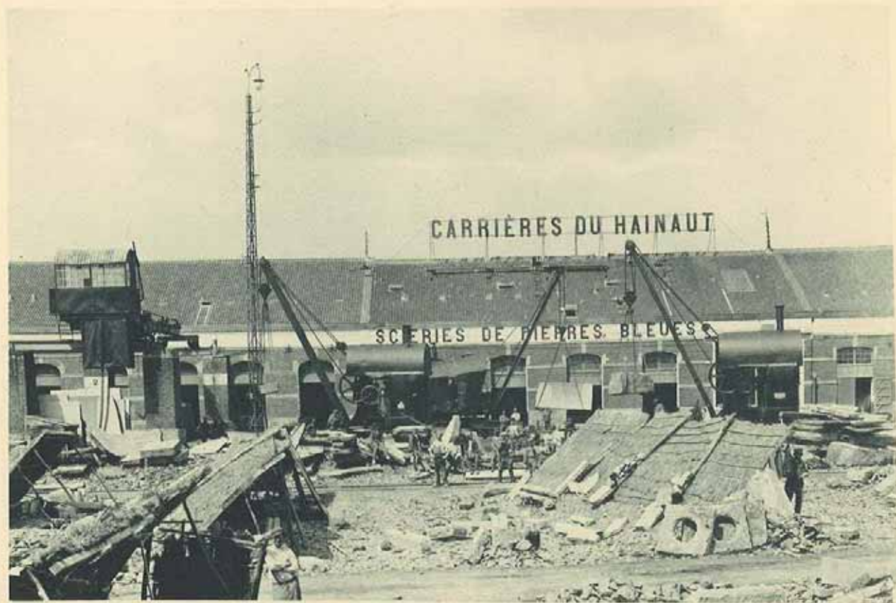
Pont roulant et Grues à flèche