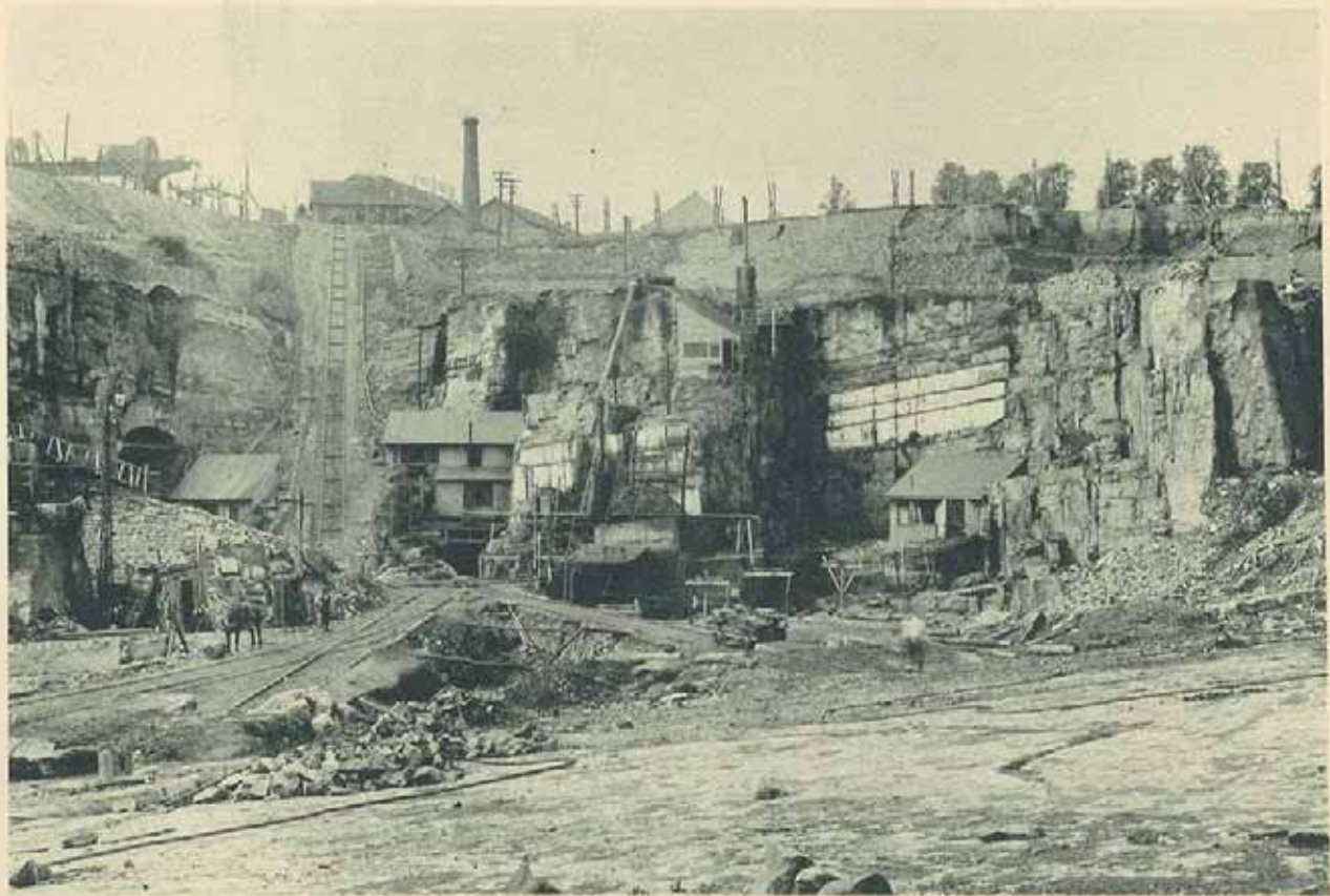
Gisement et Rampe Ouest