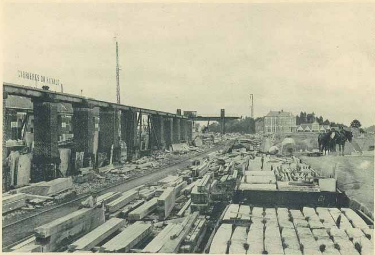
Quai de Chargement et Dépôt de Sciage