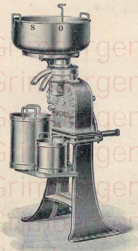
Afroofter Diabolo Prijs : met voetstuk 280 fr. Dezelfde, zonder voetstuk 255 fr. Betaling 15 fr. per maand Waarborg : 10 jaren

Men moet geen afroofter kleiner dan 120 liters koopen, want men moet te lang draaien en, bijgevolg is de afrooftering zoo goed niet en den afroofter verslijt rapper. Bovendien, kan een afroofter van ten minsten 120 liters voor verschillende koeien dienen, terwijl eenen kleinderen onvoldoende word als men eene koe of twee bijkooft.