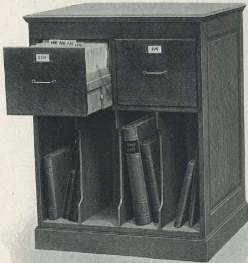
TYPE N° 2