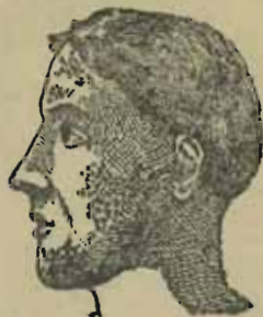
Dawworm van het aangezicht