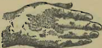
Eozéma der hand