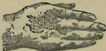
Eczéma de la main