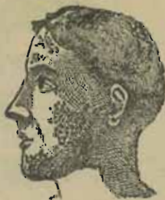
Dartres de la face