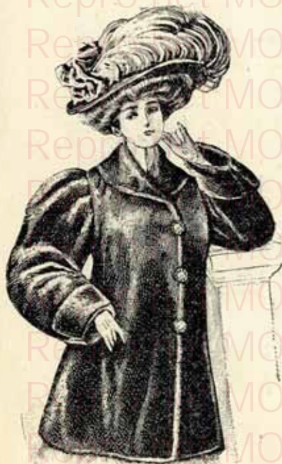
Joli Paletot, peluche Lister, en différentes longueurs, 1/2 cintré et ajusté depuis fr. 89.00