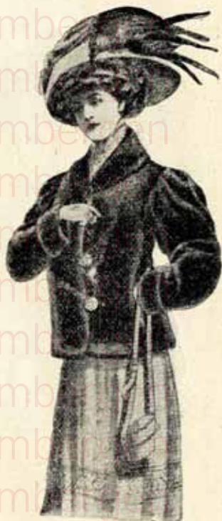
Magnifique Jaquetto, loutre d'Islande, garantie à l'usage fr. 69.00