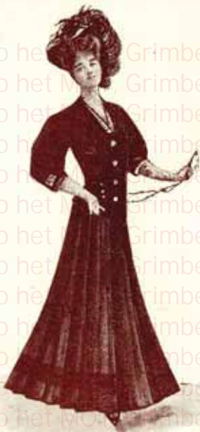
MODÈLE SYMONNE Prix: 95 Francs