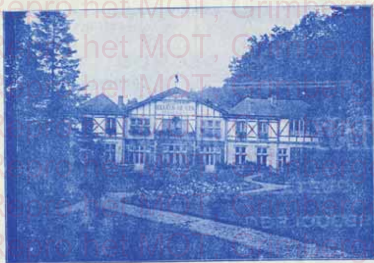
Vue de la Distillerie de l'Elixir de Spa