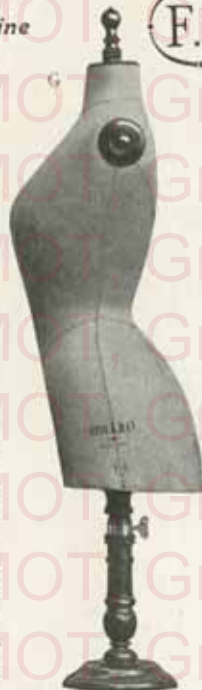
Du cou à terre : hauteur 1 m 05