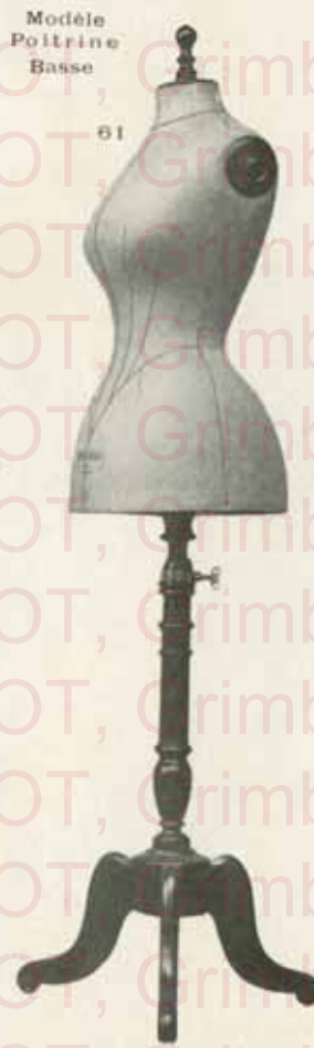
Modèle Poitrine Basse