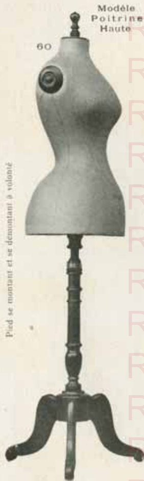
Modèle Poitrine Haute