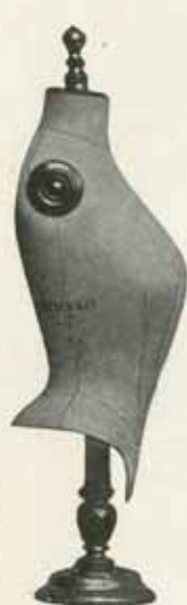
Du cou à terre : hauteur 0 m 71