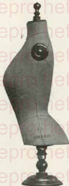
Du cou à terre : hauteur 0 m 81