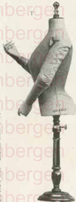
Du cou à terre : hauteur totale 1 m 25