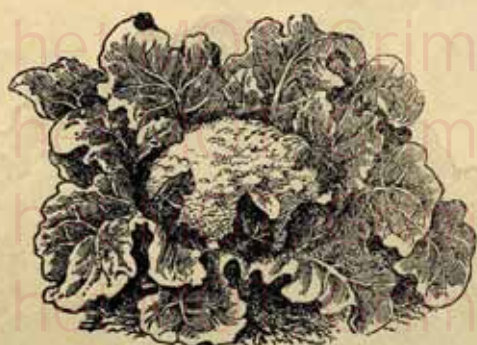
Chou-Fleur géant « Le Favori des Campagnards ».