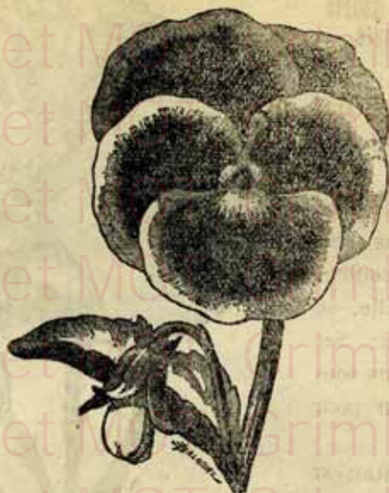
Pensée géante, variété « LA BELGIQUE »