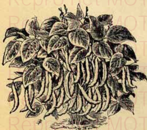
Haricot nain mange-tout, extra sans filet, « PERFECTION DE TIHANGE »