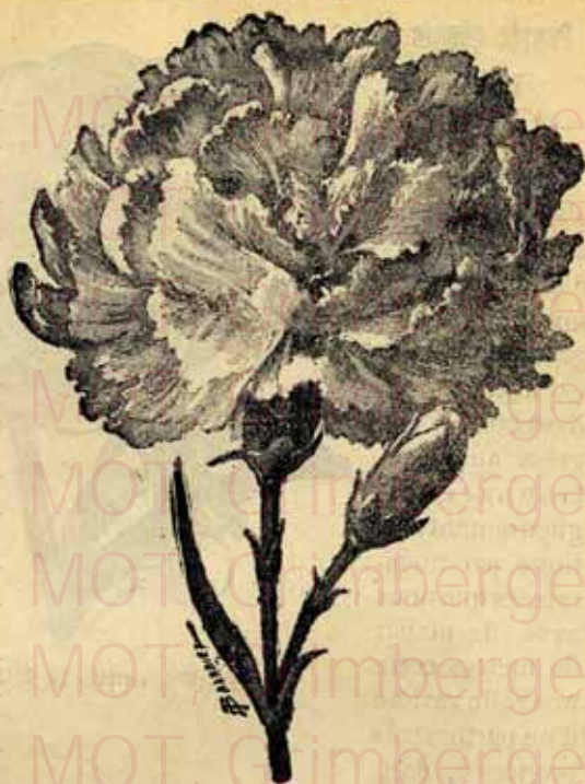
Œillet mignardise, double, rouge, vif, velouté