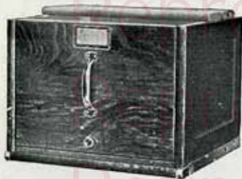
Tiroir pour le classement vertical des dossiers