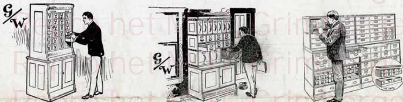
Le Bureau de renseignements généraux et documentation technique à l'Exposition Internationale (à droite de l'entrée principale du Grand Palais, section belge), a été monté avec nos Meubles-classeurs « GLOBE »

ACCESSOIRES pour le classement de toute première qualité. (Voir tarif détaillé ci-après.)