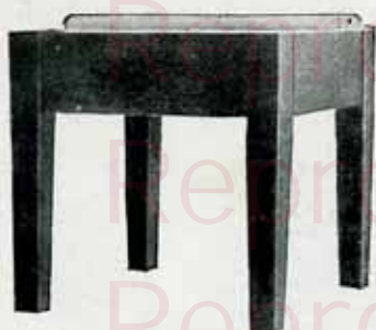
Base sur pieds