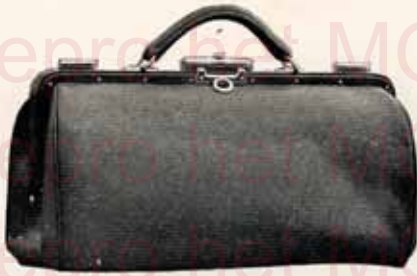
Modèle N° 1