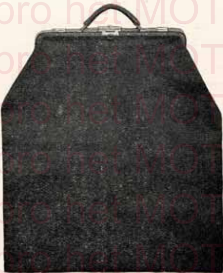
Sac à linge en toile brune

Intérieur papier . Fr. 4.— " cuir . . . . . " 4.50