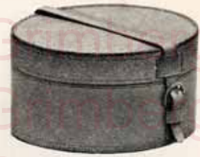
Boîte pour cols

Intérieur papier . . . . . Fr. 6.25 " cuir . . . . . " 7.—