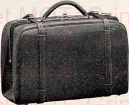
SAC CARRÉ A COURROIES