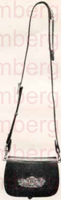
Gibberne de Musicien.