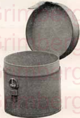
Boîte pour manchettes

Petit { Int. pap. Fr. 3.— modèle { " cuir " 3.50 Grand { Int. pap. Fr. 3.75 modèle { " cuir " 4.25