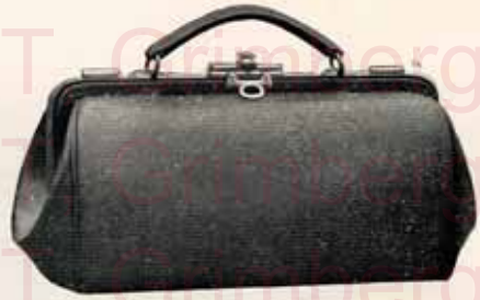
Modèle N° 2