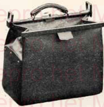
A une poignée.