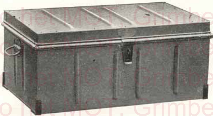
Modèle de la malle „Exportation“