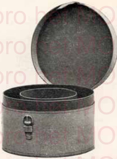
Boîte pour cols et manchettes

Intérieur papier . . . . . Fr. 6.25 " cuir . . . . . " 7.—