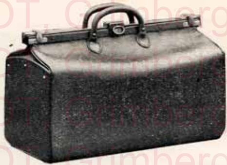
A deux poignées.