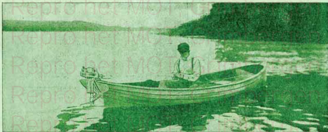
Le " PONEY-CANOT " , monté sur une barquette de pêche

BRUXELLES. — 10, rue Berckmans (Avenue Louise)