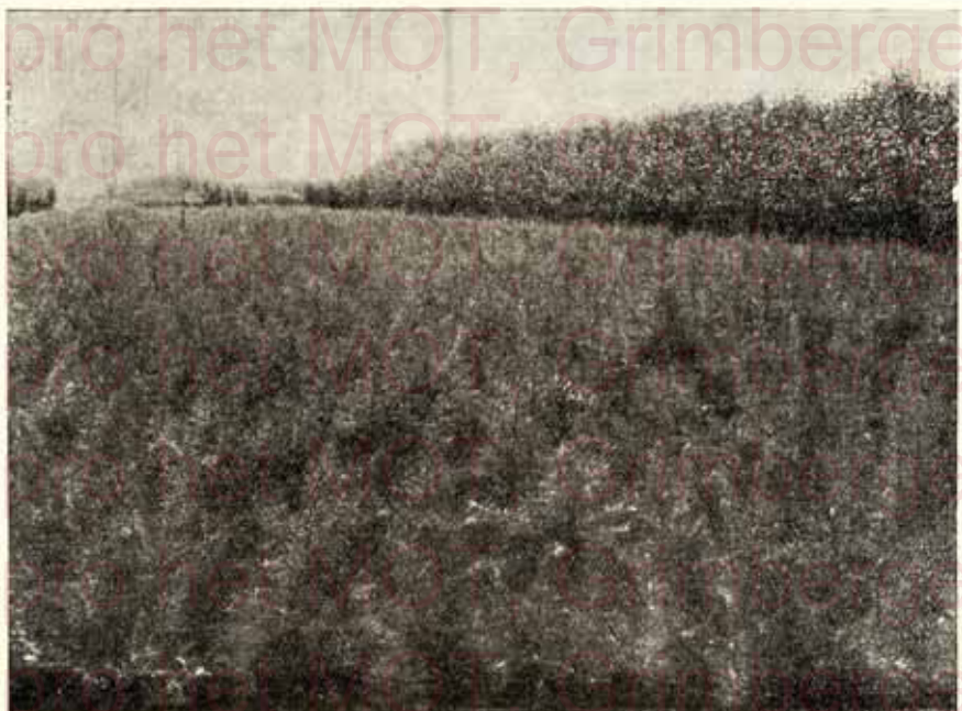
Un carré Mélézes du Japon, transplanté de 1.00 à 1.50 m. et 1.50 à 2.00 m. Extra. Page 7. Een partij Japoneesche Larix, herplant van 1.00 à 1.50 m. en 1.50 à 2.00 m. zeer sterke planten. — Bladz. 7.