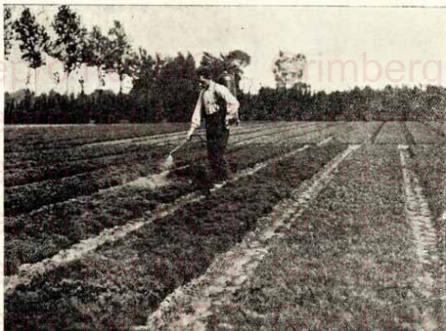
Notre culture des Resineux, telque : Pin-Sylvestre, semis 1 an ; Pin-Laricio-de-Corse, semis 1 an ; Pin-Noir-d'Autriche, semis 1 an. Extra qualité. — Page 5 et 6. Onze kwekerij van Sparregewas, zooals : Gewone Den, 1 jaar zaail ; Corsikaansche Den, 1 j. zaail ; Austriaca Den, 1 j. zaail. Sterke gezonde planten. — Bladz. 5 en 6.