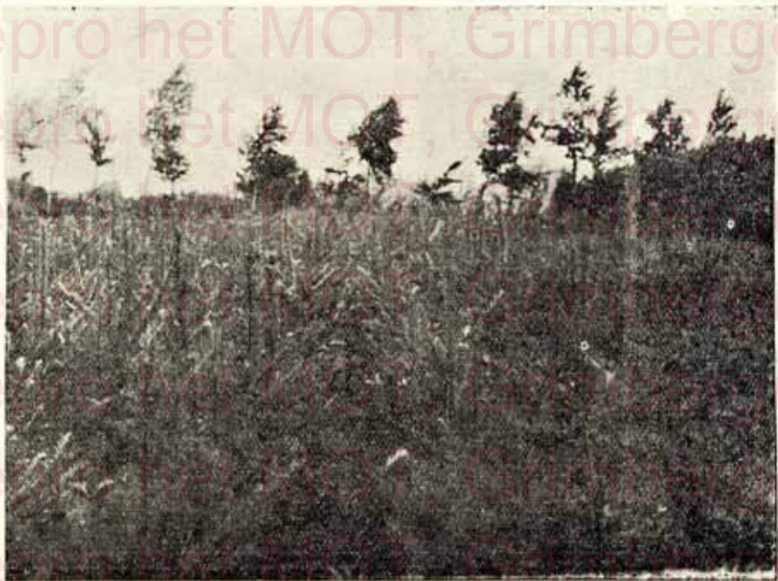
Un carré Abies Douglas, verts, avec motte de terre de 1.30 à 1.50 et 1.50 à 2.00 m. — Page 7. Een partij Abies Douglasi, groen, met aardkluit, 1.30 à 1.50 m. en 1.50 à 2.00 m. — Blz. 7