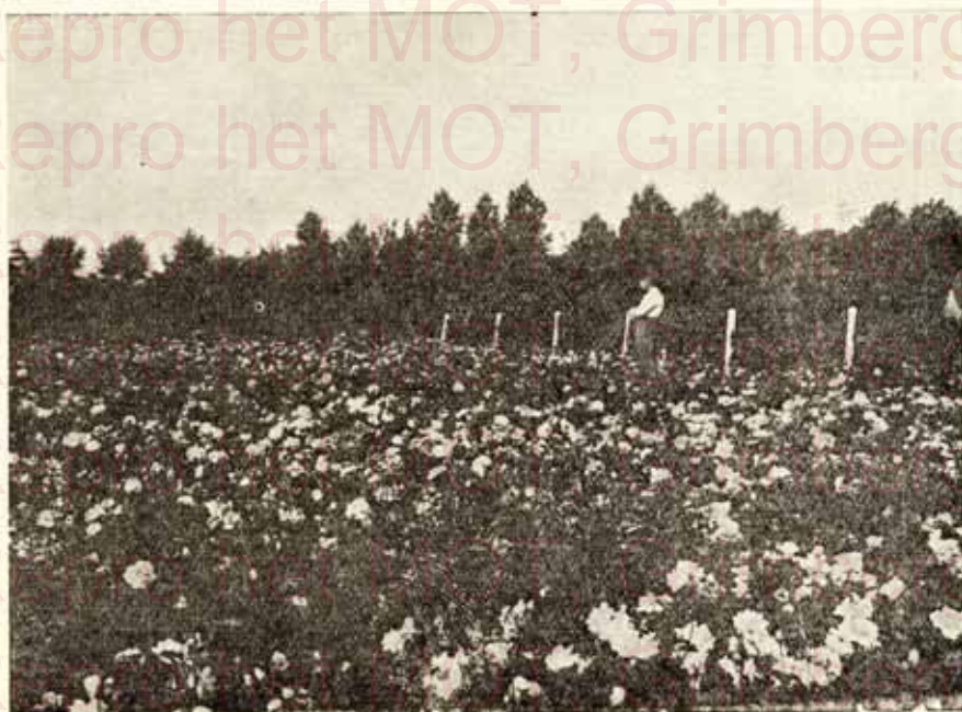
Notre culture des rosiers nains aux variétés le plus recommandées.

Onze kwekerij van Groene Ligustrum, voor hagen, verplant en gesneden van 0.50 à 1.00 m. en 0.60 à 1.20 m. Zeer goede hoedanigheid. — Bladz. 6.