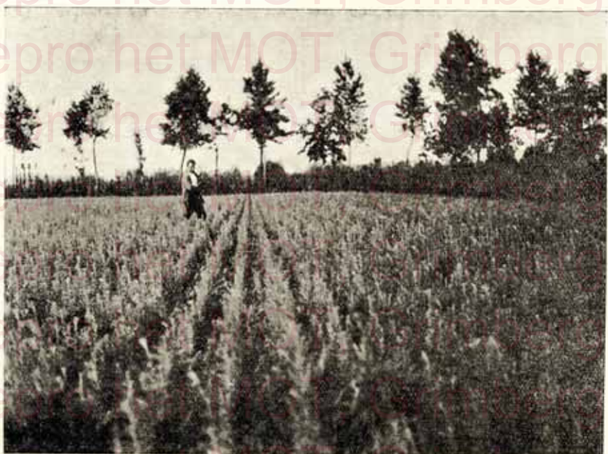
Notre culture des Mélèzes du Japon, repiquées un an, de 0.30 à 0.60 m. et 0.40 à 0.70 m. disponible par cent mille, en plantes très forts. — Page 5. Onze kwekerij van Japoneesche Larix, verplant 1 jaar, 0.30 à 0.60 m. en 0.40 à 0.70 m. beschikbaar per honderd duizende, in zeer sterke planten. — Bladz. 5.