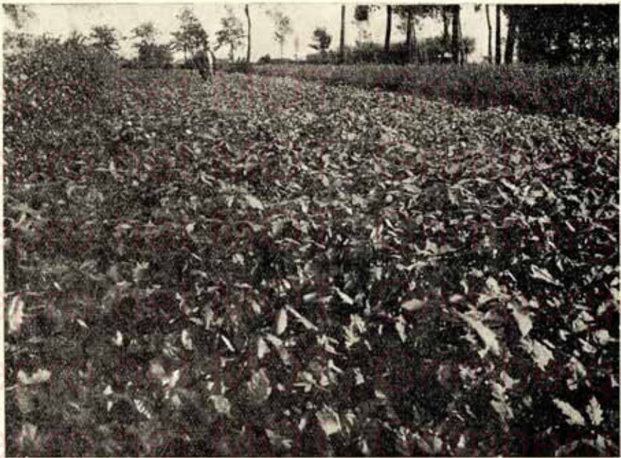
Une partie plantes feuillus, Chêne d'Amérique, repiqués de 0.60 à 1.20 m. et 0.80 à 1.50 m. — Page 3. Een partij Amerikansche eik, verplant van 0.60 à 1.20 en 0.80 à 1.50 m. — Blz. 3.