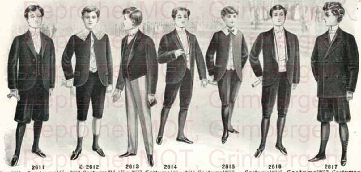
Fig. 2611. Costume forme veston boutonnant par 2 boutons, avec jolie bordure et revers soie. En corkscrew noir. Confectionné à 45, 50 et 55 fr. Se porte avec gilet blanc. Le gilet seul 4.90 6.90

Les costumes de Communion NON BORDÉS coûtent 5 fr. DE MOINS que les prix ci-contre.