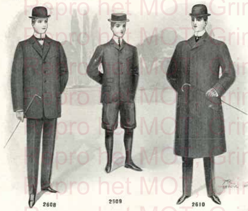
Fig. 2608 et 2609. Costumes vestons en tissus anglais, jolie fantaisie, coupe et façon soignées.

Pour jeunes gens de 12 à 14 ans : Sur mesure : de 32 à 40 fr.