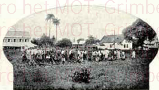
Personnel de Plantation

Ses plantations, comme sa réputation d'ailleurs, sont vieilles comme le monde et par suite, toutes ses terres, réellement susceptibles de pouvoir nourrir leurs plantes, sont depuis longtemps en culture. La production de Java est donc strictement limitée; nous pouvons même dire qu'elle est excessivement réduite puisque son territoire est relativement petit, comparativement à l'immense étendue que représente le Brésil. De ces considérations se dégage une conclusion logique: c'est que les cafés de Java doivent forcément se vendre à un prix plus élevé. Mais en plus de ceci, il est un autre argument qui plaide puissamment en faveur des cafés de Java: c'est que la plante qui le produit est réellement de race et que son arôme est incontestablement unique.