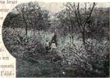
Caféiers en fleurs (Java).

Cependant, les connaisseurs savent que par suite des exigences d'une exploitation moderne, dans une contrée nouvellement ouverte à la civilisation et à la culture, des plantations neuves également, sont, par suite d'une récolte trop intensive, incapables de produire des cafés de choix. Voilà pourquoi les cafés Brésiliens dits Santos, Rio, Bahia , n'ont aucune qualité qui doivent les distinguer; voilà pourquoi aussi, en raison de l'aptitude de leur exploitation, ces cafés coûtent bon marché. Et si même, les cafés du Brésil sont choisis dans les meilleurs qualités, ils conservent néanmoins leur goût de terroir et leur saveur âcre parce que leurs plants n'ont pas les qualités de race voulues pour être suffisamment riches en huile essentielle constituant l'arôme et l'élément principal du bon café.