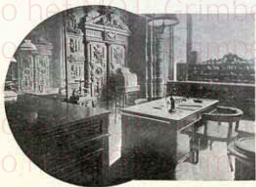
Bureaux de la Direction de la Maison Jacquotte.

Réduction de prix pour hôtels, restaurants et pensionnats.