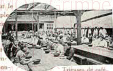
Triçuses de café.

Ces mélanges ont été étudiés et combinés de façon à donner à l'arôme son maximum de puissance et de finesse de goût.