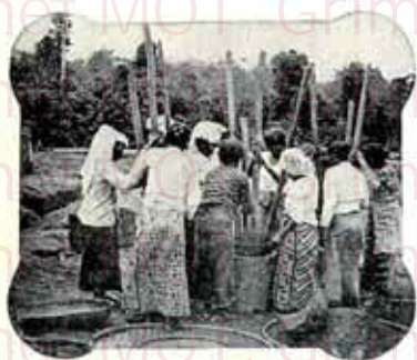
Décortiquage du café (Java)

JACQMOTTE. | Cependant pour obtenir une bonne tasse de café, il ne suffit pas de savoir que ce breuvage délicieux se prépare avec des graines de choix, il faut encore pouvoir se procurer ces graines. C'est ici que nous nous permettons de faire ressortir au lecteur les moyens dont nous disposons. C'est de père en fils, et depuis plus de trois quarts de siècle que la Maison Jacqmotte entretient des relations continuelles d'achat, aux pays mêmes de production. Ses agents résident sur les lieux de culture et font l'importation directement de Java et d'ailleurs. Ces agents se passent de tout intermédiaire. C'est donc avec garantie de provenance absolument authentique que les cafés sont livrés aux clients-consommateurs.