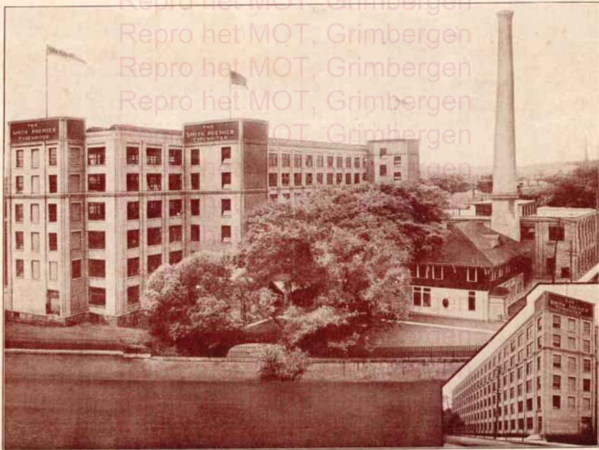
USINES DE LA SMITH PREMIER TYPEWRITER Co., SYRACUSE, NEW YORK STATE, U. S. A.

REPRODUCTION OF THE ORIGINAL TYPEWRITER COMPANY - 1908