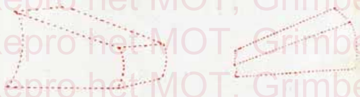
Deux positions que le Kalamazoo ne prend pas.

d'elles-mêmes au nombre de feuilles que le livre contient ; et comment la flexibilisation le long de la marge intérieure de chaque feuille portant la marque Kalamazoo, empêche la perte de temps en appuyant sur les feuilles pour les aplatis. Celles-ci se placent à plat d'elles-mêmes.