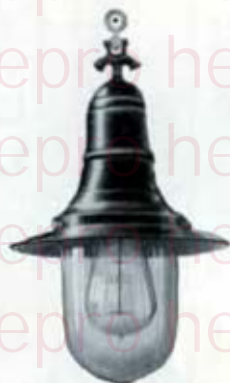
1275 à fixation par vis