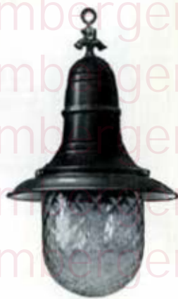
1276 à fixation par vis et globe de verre optophone