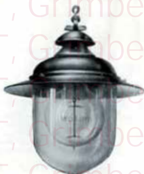
1273 à fixation par vis