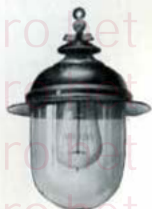
1271 à fixation par vis

pour lampes à incandescence jusqu'à 1000 bougies