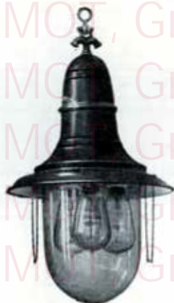
1276 avec bague, chaînettes, et fermeture articulée