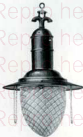
1261 avec globe en verre optophaue