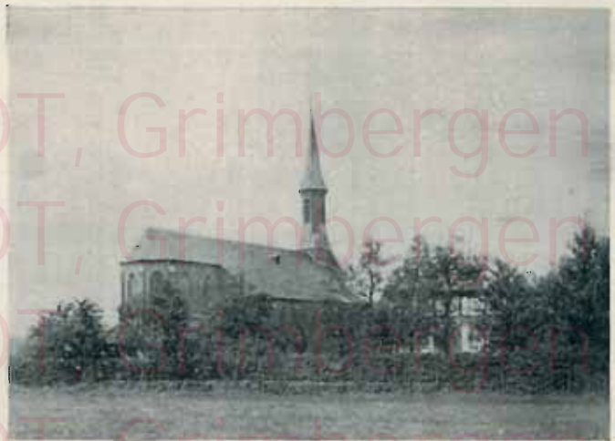
ÉGLISE DE HEYNDONCK (lez-Willebroeck) Appareil de 20 becs — Type C

Pour installation de 15 à 65 becs — Voir Prospectus spécial