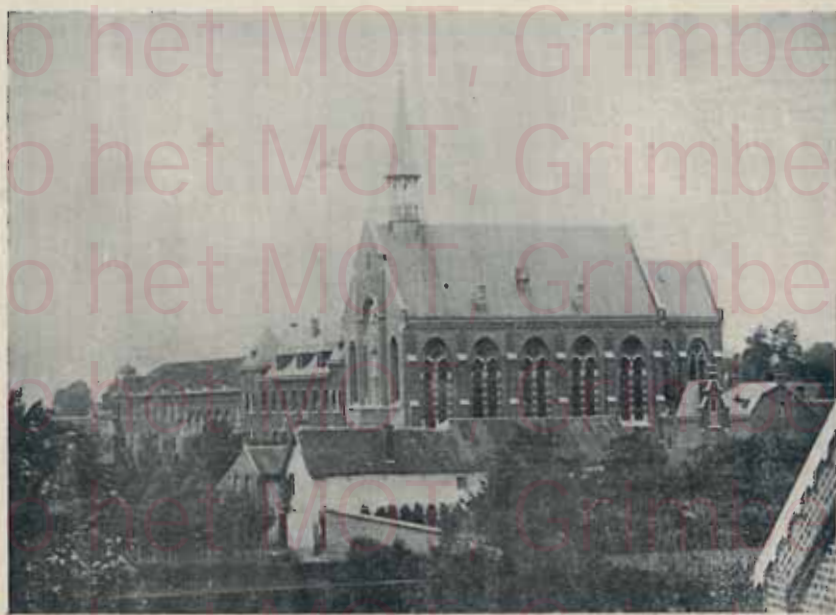
PENSIONNAT DES DAMES URSULINES, A FOURON-LE-COMTE (BELGIQUE) Installation de 150 becs - Appareil type D de 80 becs