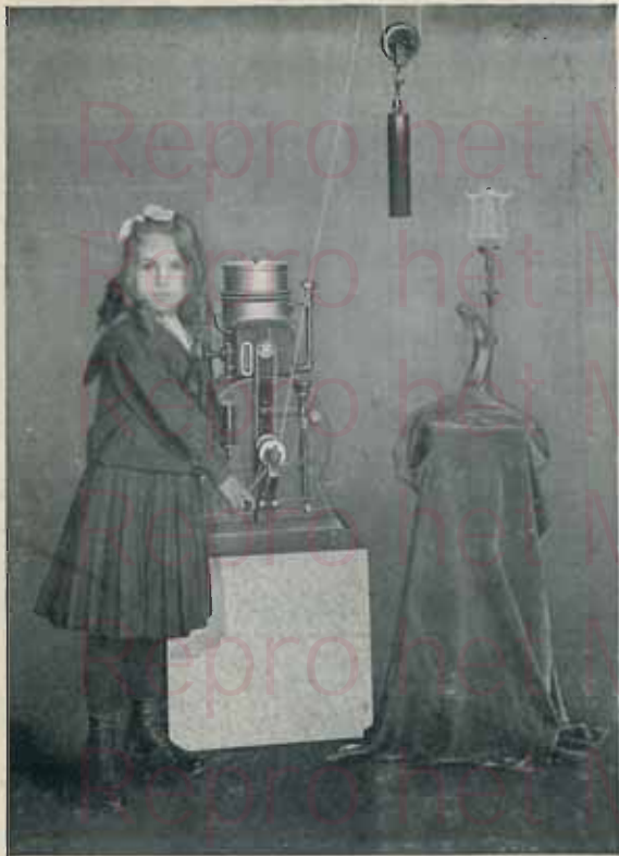
Appareil type C

Pour installation de 15 à 65 becs — Voir Prospectus spécial