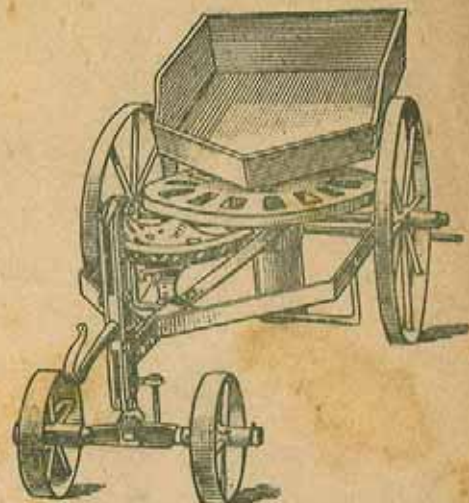
Vue en position de travail.

Cette nouvelle Machine, d'une simplicité très grande, pour ce qui concerne la construction, promet toute approbation.