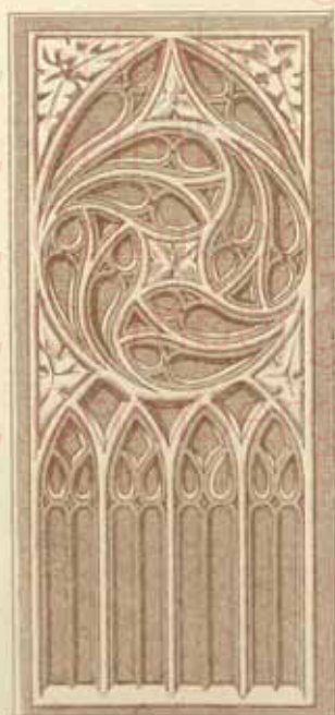
N° 31 \frac{0.44 \times 0.20}{0.035}