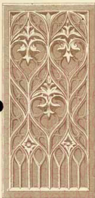
N° 28 \frac{0.44 \times 0.20}{0.025}