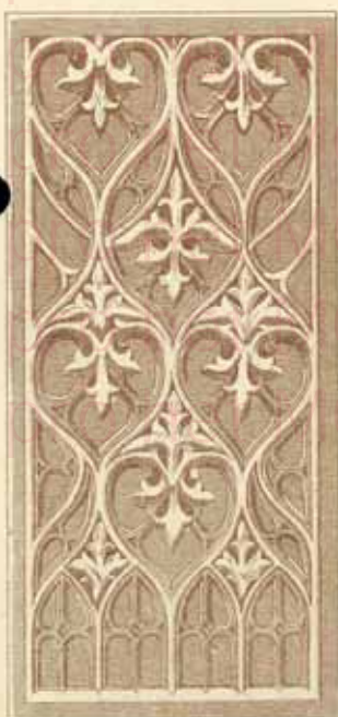
N° 30 \frac{0.44 \times 0.20}{0.025}