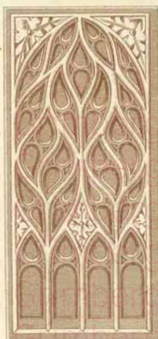
N° 29 \frac{0.44 \times 0.20}{0.035}